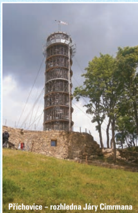
Příchovice - rozhledna Jára Cimrmana