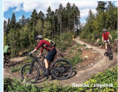
Benecko - singeltrék

Špindlerův Mlýn - Svätý Petr Rokytnice n. Jiz. - Horní Domky Pec pod Sněžkou - Hnědý vrch Trutnov Trails - Lhotecská, Trutnov